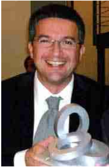
Il Sindaco con il premio Oscar di Bilancio