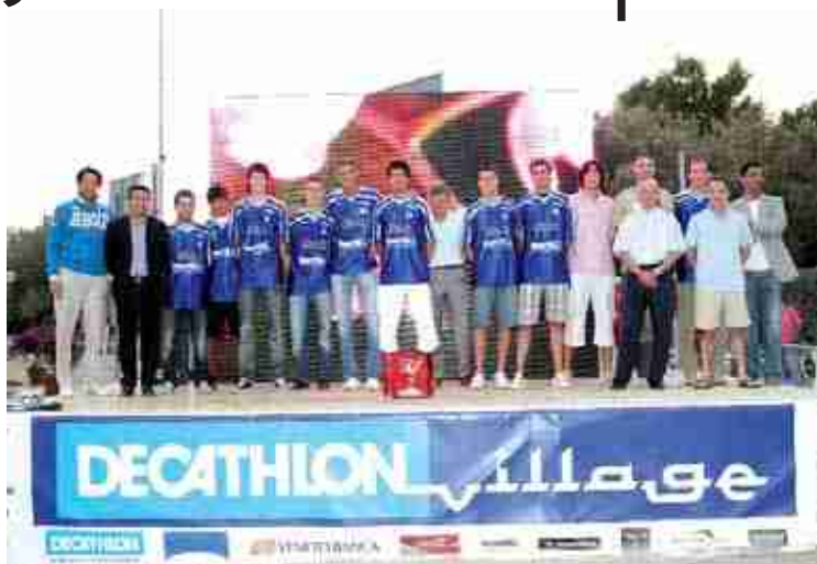
Lo Smile Basket Jesolo - San Donà promosso in serie B: la squadra premiata dal Sindaco al Villaggio Mondiale.

Che annata di sport a Jesolo! Calcio, basket, calcio a 5: ottimi risultati, prestazioni da prima categoria e conseguenti promozioni.