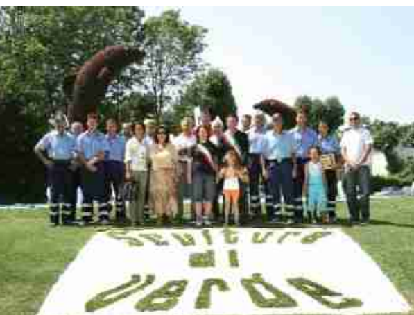
Autorità e i giardinieri del Servizio Verde Pubblico

Alla base c'è un'arte molto antica che si basa sulla propensione che hanno certe piante di farsi modellare a piacere: l'ars topiaria, infatti, altro non è se non la tecnica che permette la potatura delle piante seguendo forme diverse rispetto a quelle naturali. Grazie all'utilizzo sapiente di questa tecnica i giardinieri del Servizio verde pubblico del Comune sono riusciti a creare bizzarre forme che hanno arricchito un'area urbanistica tra le più nuove e belle di Jesolo. A fare da corollario all'insieme anche una ricca selezione di accorgimenti estetici: elementi lapidei, magnifiche fioriture e spruzzi d'acqua, e un'accurata scenografia di illuminazione che inquadra le singole sculture. Uno spettacolo da non perdere.