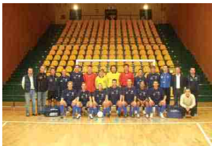
La squadra Jesolo Calcio a 5: per loro promozione in serie C1 dopo un campionato condotto fin dall'inizio in testa alla classifica.

"Si sapeva che l'avventura in C2 sarebbe stata molto dura - conclude il Sindaco - ma i ragazzi sono scesi in campo con lo spirito giusto, facendosi valere per il loro impegno. Un doveroso grazie a tutti loro".