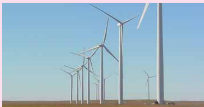
Un esempio di impianto eolico. Il vento è la prima tra tutte le energie rinnovabili.

La bioedilizia è l'insieme di accorgimenti che conducono a realizzare costruzioni a basso impatto ambientale. I criteri di progettazione degli edifici bio-edili o sostenibili ambientalmente, riguardano sia la riduzione dei consumi energetici che il risparmio delle altre materie prime, quale, ad esempio, l'acqua. Gli edifici di edilizia sostenibile, sono quindi costruzioni attente sia al consumo di risorse, sia ai carichi ambientali (riduzione delle emissioni di CO2 derivanti dall'insediamento). Nella progettazione di tali edifici, viene prestata attenzione particolare alla manutenibilità dell'edificio (al fine di ridurre, nel tempo, i costi derivanti dalla gestione del fabbricato). Viene inoltre prestata attenzione alla qualità degli interni, al fine di realizzare un fabbricato più confortevole per i suoi residenti.