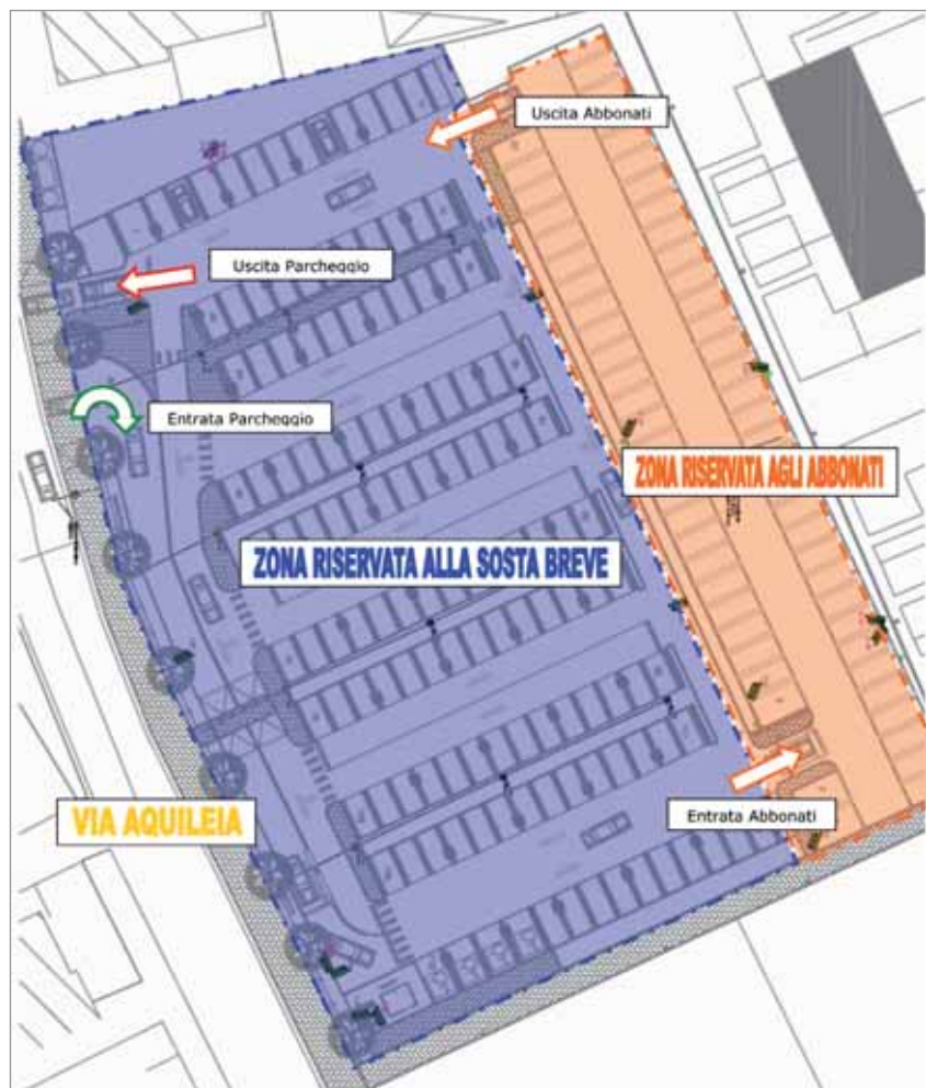
La planimetria del parcheggio Volta