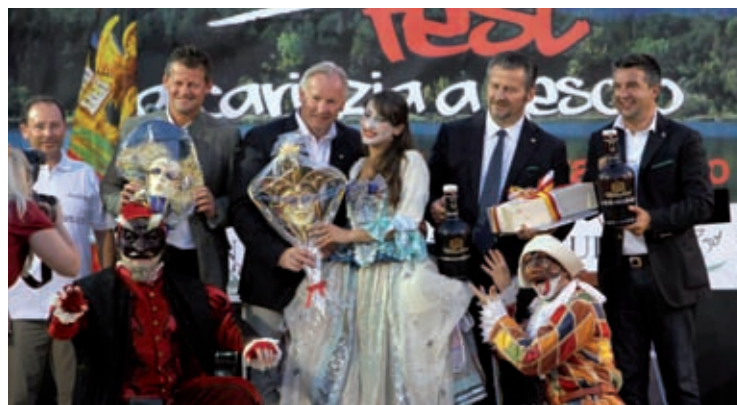
Scambio di doni sul palco del Kärnten Fest.