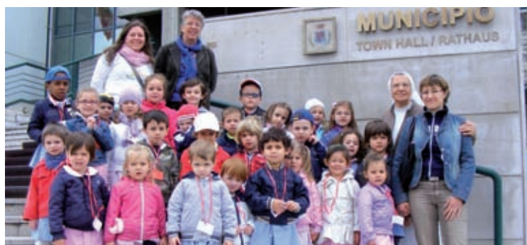
I bambini della scuola materna Santa Rita in visita lo scorso 5 maggio.

La visita dei bambini si conclude con l'incontro con l'assessore Carli che consegna a tutti il rispettivo atto di nascita e un fac simile della carta di identità.