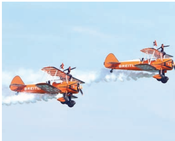
Wing Walker Breitling, gli aerei Stearman con due donne che si esibiscono sulle ali.