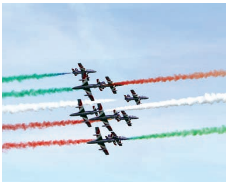
La Pattuglia acrobatica delle Frecce Tricolori si alza in volo su Jesolo.