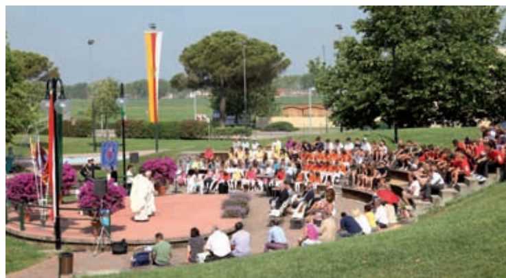
Un momento della Santa Messa celebrata in italiano e austriaco al Parco Grifone.