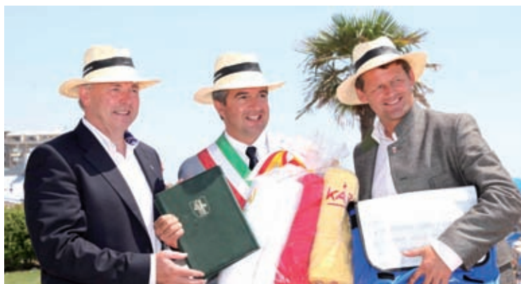
Il governatore della Carinzia, Gerard Dörfler, il sindaco di Klagenfurt Christian Scheider assieme al sindaco di Jesolo, Francesco Calzavara.

che. Una collaborazione che mira anche alla promozione turistica e allo sviluppo di attività culturali sociali sportive e di comunicazione tra Jesolo e Klagenfurt, suggellata dalla firma della dichiarazione d'intenti da parte dei rispettivi sindaci, il documento che pone le basi per il futuro gemellaggio tra le due località. In serata grande festa in piazza Milano con momento enogastronomici e di spettacolo.