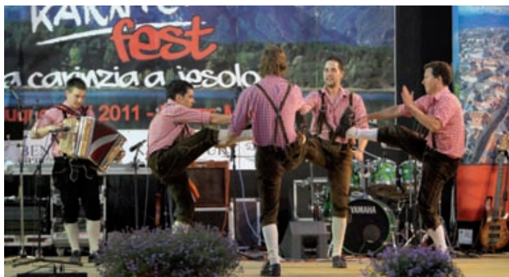
Momenti di spettacolo tipico della Carinzia.