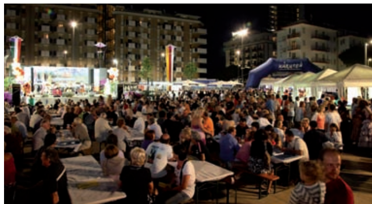
Seduti ai tavoli per gustare le prelibatezze della cucina tipica.