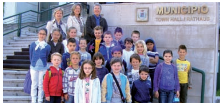
Gli alunni della Scuola Verga in visita il 6 maggio.