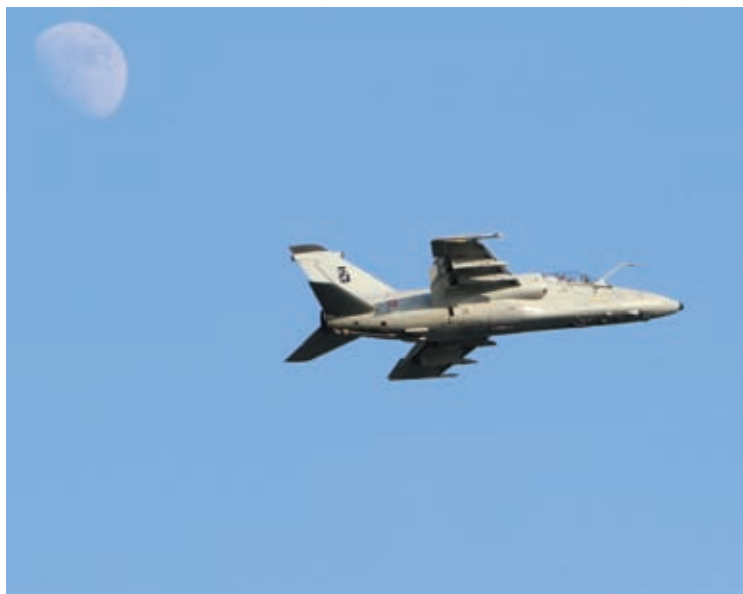
Il volo imperioso di Eurofighter, l'aereo da caccia dell'Aeronautica Militare.