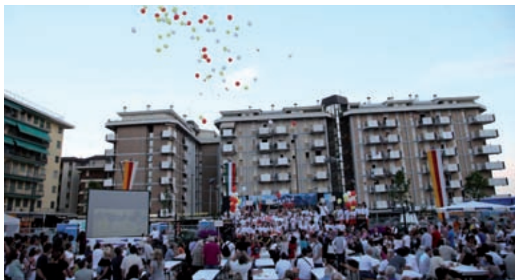
Piazza Milano al momento dell'imbrunire si popola di pubblico.