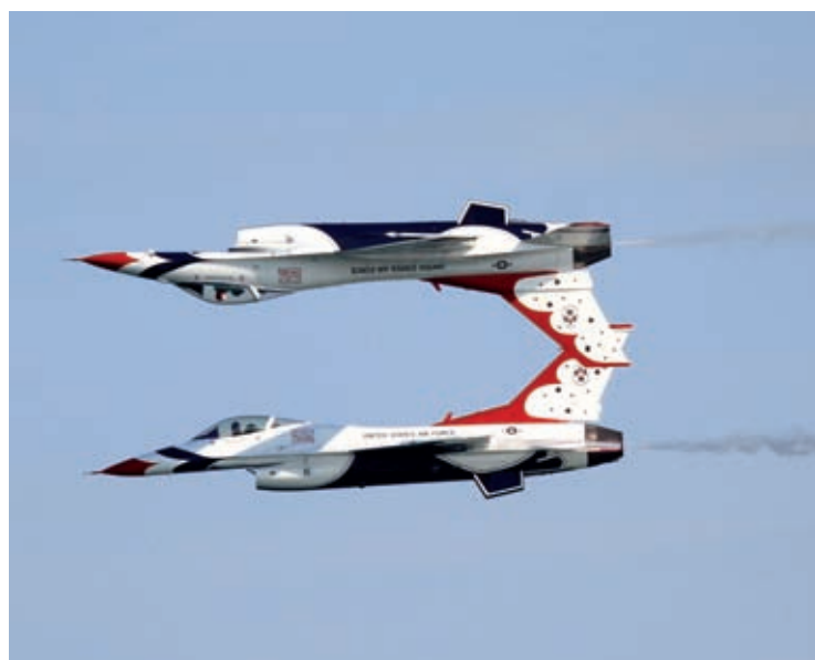
L'unica performance italiana dei Thunderbirds, la pattuglia acrobatica dell'aeronautica militare Usa, è stata proprio allo Jesolo Air Show.