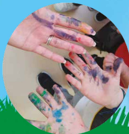
MOSTRA ATTIVITÀ DEI BAMBINI DELLA SCUOLA DELL'INFANZIA "MUNARI"