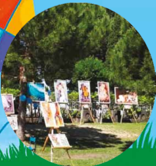
MOSTRA COLLETTIVA D'ARTE