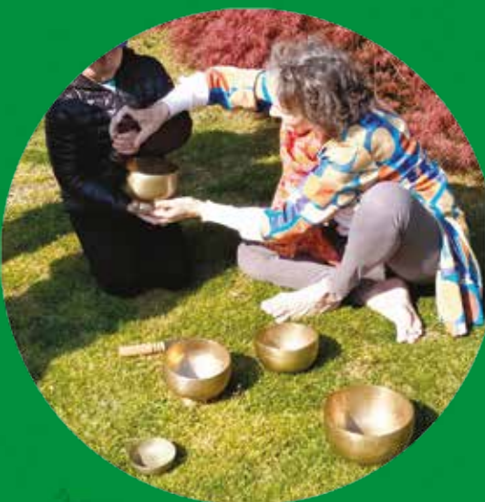
STUDI OLISTICO CAMPANE TIBETANE