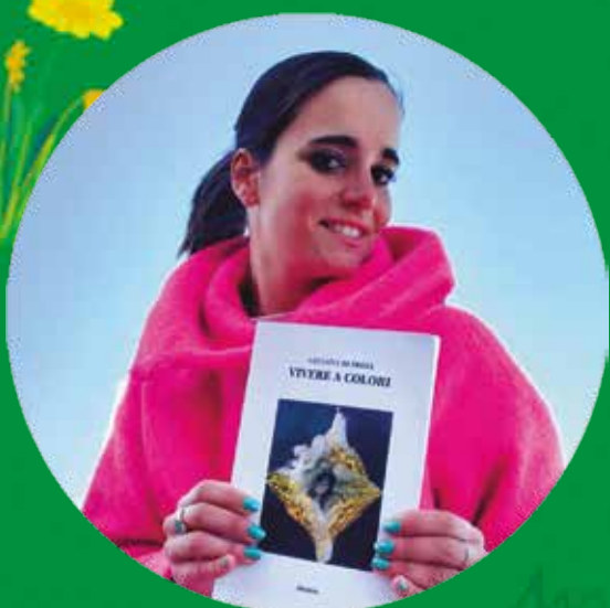
PRESENTAZIONE DEL LIBRO VIVERE A COLORI