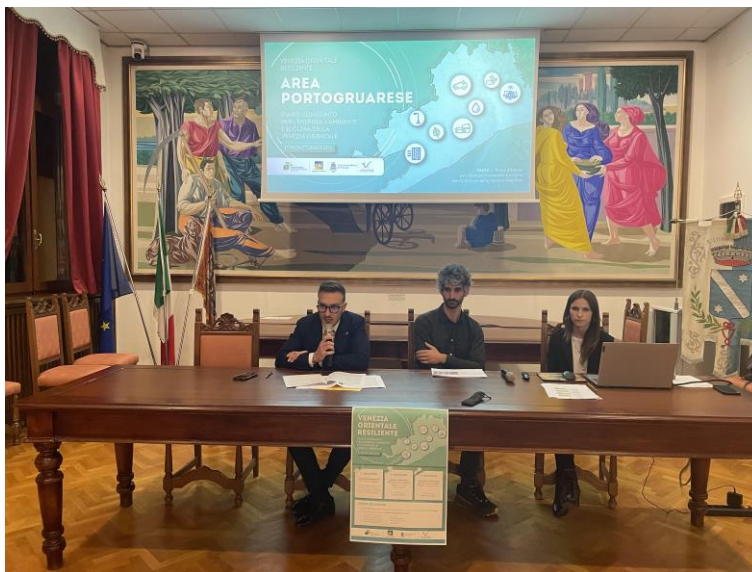
Incontro a San Stino di Livenza del 9/11/2023.