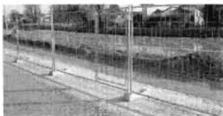
RECINZIONE DI CANTIERE